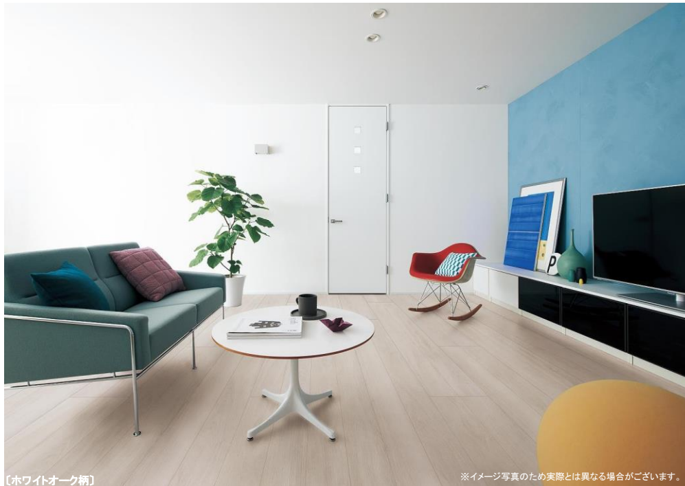
【ホワイトオーク柄】