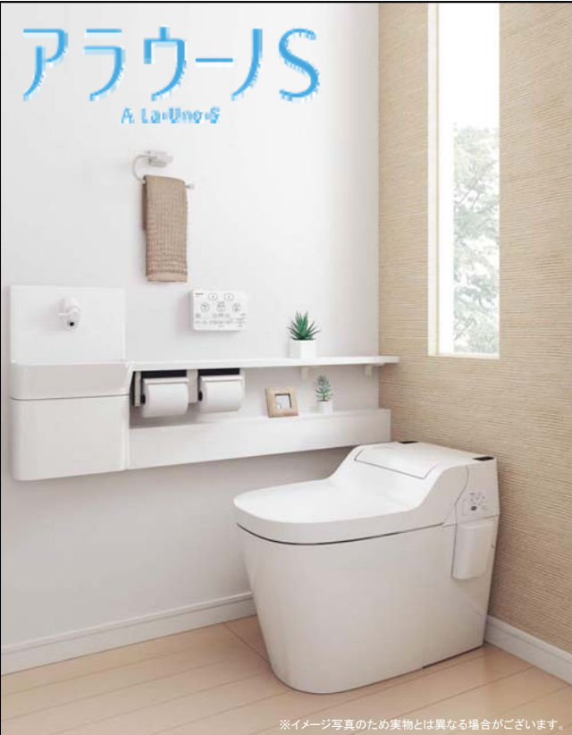
※イメージ写真のため実物とは異なる場合がございます。